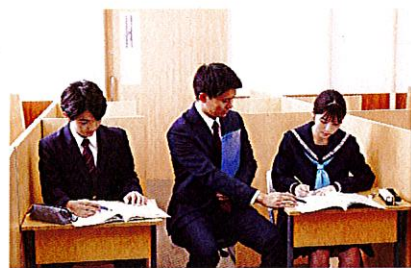
(講師1対生徒2の個別指導)